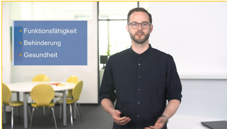
Abbildung 3: Beispiel animierter Erklärfilm